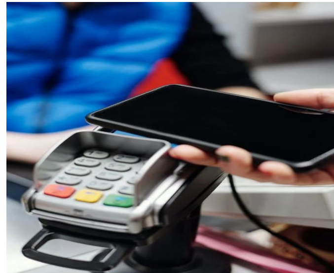
app per pagare