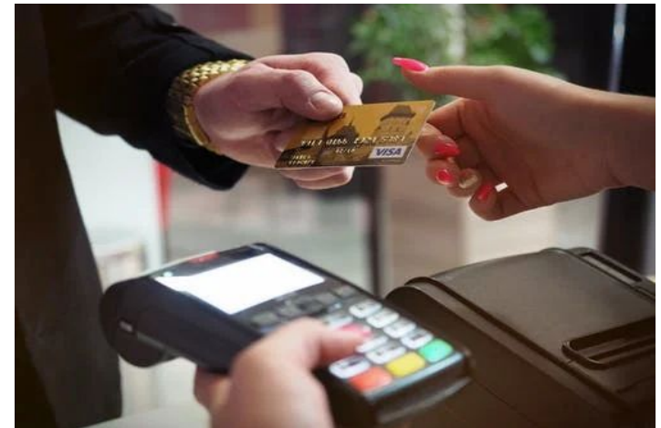
cartacontactless e pos

Il sistema di pagamento contactless o pagamento senza contatto è un sistema che permette di effettuare acquisti tramite carte di credito o di debito, smart card, smartphone e altri dispositivi, per mezzo delle tecnologie RFID e NFC. Le carte contactless, a differenza delle carte tradizionali dotate di banda magnetica e microchip, non richiedono l'inserimento fisico della carta nel lettore ma solo l'avvicinamento della stessa, a patto di non superare una certa soglia di distanza.