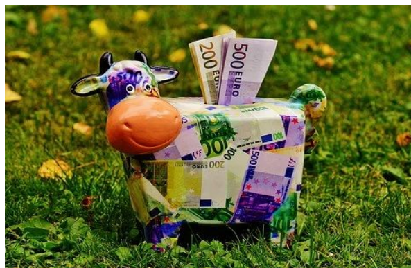
Mucca salvadanaio

Il conto corrente è uno strumento bancario che indica il deposito di denaro da parte del titolare/possessore del conto all'interno di un istituto di credito, e che consente l'utilizzo di moneta bancaria